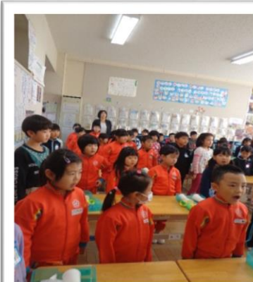
青潮小学校での交流会。緊張した顔の年長さん、雰囲気は一年生です。