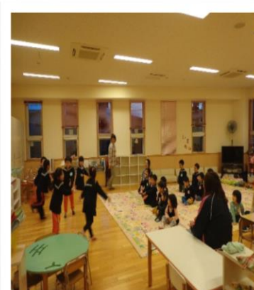
預かり保育では、ミニおゆうぎ会が始まり、拍手喝采で賑わっていました。