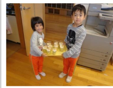
年中さんのお料理会、どうぞ召し上がれと持ってきてくれました。