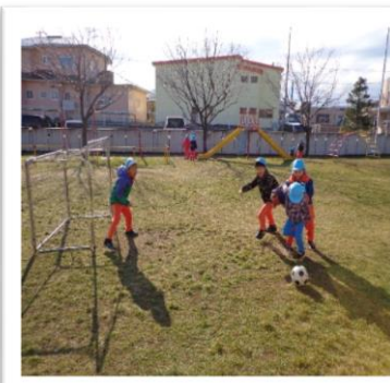
お外でサッカー・ベランダでは縄跳び 元気いっぱい！