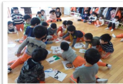
「手作りかるた」で遊ぶそら組さん。