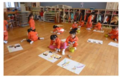
楽しかった「おゆうぎ会」を思い出しながら描いているほし組さん。