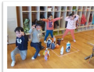
元気なつぼみ組さん、ボーリング遊びに夢中です。

新年あけましておめでとうございます。元気な子ども達同様、本年もどうぞよろしくお願いいたします。