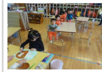
先生と一緒にカレーライスを描いている、たんぼ組さん。美味しそうに描けました。