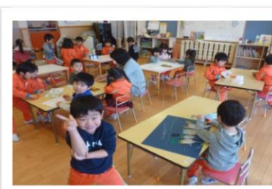
自主活動中のすみれ組さん。