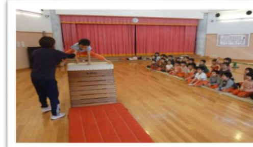
体育教室で跳び箱に挑戦するにじ組さん。2クラス共5段からスタートし最高8段跳びに挑戦中です。