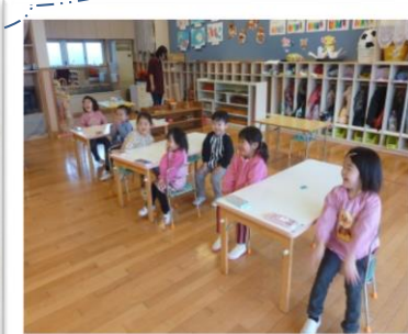
ちゃんとお座りをして先生のお話を聞いているつくし組さん。