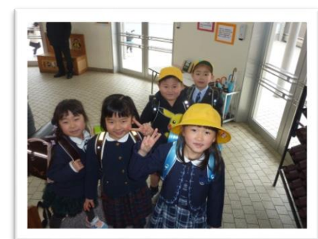
入学式を終えた新一年生がやってきました。車に気をつけ、先生のお話をよく聞いて楽しんでください